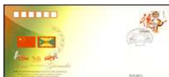
5 J. Dipl. Bezieh. mit Grenada, 20.01.2010