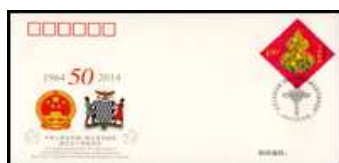
Dipl. Beziehungen mit Sambia 29.10.2014 Chi-PFTN WJ 2014-18 2,00 €