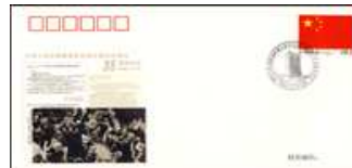
35 J. Wiedererl. d. Rechtmäßigkeit in der UN, 25.10.2006 Chi-PFTN WJ 162 2,00 €