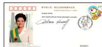
Staatsbesuch der Brasilianischen Präsidentin, 12.04.2011