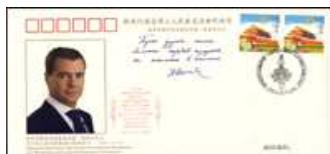
Staatsbesuch durch den Präsidents Russlands, 23.05.2008