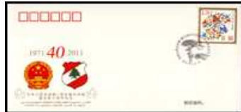
40. Dipl. Bezieh. mit Libanon 9.11.2011 Chi-PFTN WJ 2011-19 2,00 €