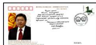
19.11.2015 Chi-PFTN WJ 2015-20 2,20 €