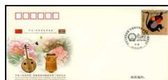
Dipl. Beziehungen mit Surinam 28.05.2016 Chi-PFTN WJ 2016-7 2,20 €