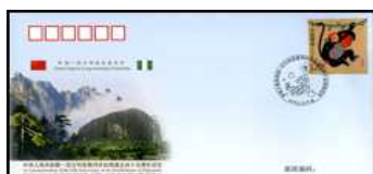
Dipl. Beziehungen China - Nigeria 10.02.16 Chi-PFTN WJ 2016-1 2,20 €