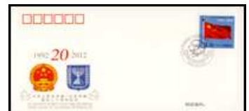
20 J. Dipl. Bezieh. mit Israel 24.1.2012 Chi-PFTN WJ 2012-8 2,00 €