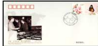
40 J. Tischtennis-Dipl. mit USA 1971-2011 Chi-PFTN WJ 2011-20 2,00 €