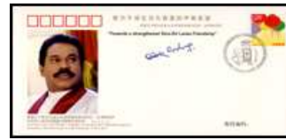
40 J. Dipl. Bezieh. m. Luxemburg 16.11.2012 Chi-PFTN WJ 2013-3 2,00 €