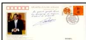
Staatsbesuch von Paul Biya, Präsident von Kamerun, 20.7.11