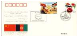
50 J. Freundsch. mit Afghanistan 20.01.2005 Chi-PFTN WJ 153 2,00 €