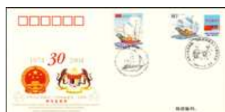
30 J. Dipl. Bezieh. m. Malaysia 31.05.2004