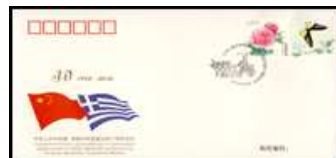
40 J. Dipl. Bezieh. m. Griechenland 5.6.2012 Chi-PFTN WJ 2012-27 2,00 €