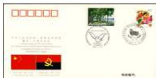
20 J. Dipl. Bezieh. m. Angola 12.01.2003