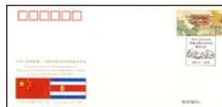
Beginn dipl. Bezieh. m. Costa Rica 01.06.2007 Chi-PFTN WJ 166 2,00 €