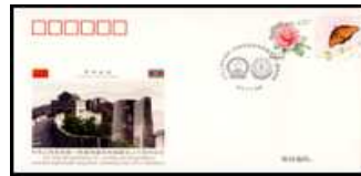
20 J. Dipl. Bezieh. Aserbaidshen 2.4.2012 Chi-PFTN WJ 2012-15 2,00 €