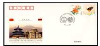
20 J. Dipl. Bezieh. mit Armenien 6.4.2012 Chi-PFTN WJ 2012-16 2,00 €