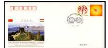
20 J. Dipl. Bezieh. mit Tadschikistan 4.1.2012 Chi-PFTN WJ 2012-4 2,00 €