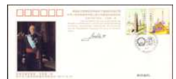
Staatsbesuch durch König Juan Carlos I v. Spanien, 24.06.2007 Chi-PFTN WJ 167 2,00 €