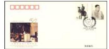
50 Jahre Bandung-Konferenz 18.04.2005 Chi-PFTN WJ 155 2,00 €