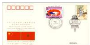
45 J. Dipl. Bezieh. m. Marokko 01.11.2003