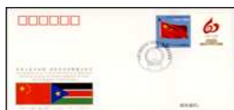
35 J. Dipl. Bezieh. mit Südsudan, 09.07.2011