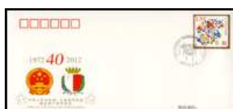
40 J. Dipl. Bezieh. mit Malta 31.1.2012 Chi-PFTN WJ 2012-10 2,00 €