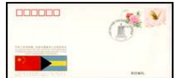
15 J. Dipl. Bezieh. mit Bahamas 23.5.2012 Chi-PFTN WJ 2012-24 2,00 €