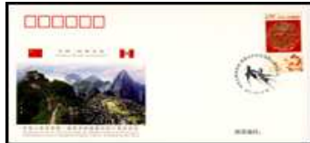
40 J. Freundschaft mit Peru 2.11.2011 Chi-PFTN WJ 2011-18 2,00 €