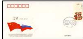
20 J. Dipl. Bezieh. Slowenien 12.5.2012 Chi-PFTN WJ 2012-19 2,00 €