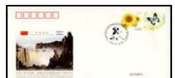
40 J. Dipl. Bezieh. mit Argentinien 19.2.2012 Chi-PFTN WJ 2012-12 2,00 €