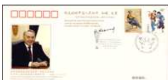
Staatsbesuch durch den Präs. Kasachstans, 19.12.2006 Chi-PFTN WJ 165 2,00 €