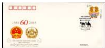
Dipl. Bezieh. mit Afghanistan 20.01.2015 Chi-PFTN WJ 2015-2 2,00 €