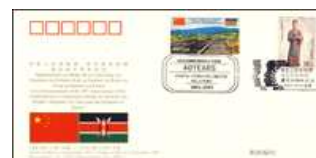
40 J. Dipl. Bezieh. m. Kenia 14.12.2003