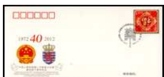
40 J. Dipl. Bezieh. m. Luxemburg 16.11.2012 Chi-PFTN WJ 2012-33 2,00 €