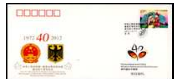
40 J. Dipl. Bezieh. m. Deutschland 11.10.2012 Chi-PFTN WJ 2012-32 2,00 €