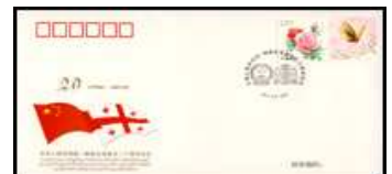
20 J. Dipl. Bezieh. mit Georgien 9.6.2012 Chi-PFTN WJ 2012-28 2,00 €