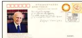
Staatsbesuch durch den Präsidents Griechenlands, 23.06.2008