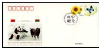
30 J. Dipl. Bezieh. mit Vanuatu 26.3.2012 Chi-PFTN WJ 2012-14 2,00 €