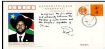
Staatsbesuch des Präsidenten des Südsudan, 23.-26.4.2012 Chi-PFTN WJ 2012-18 2,00 €