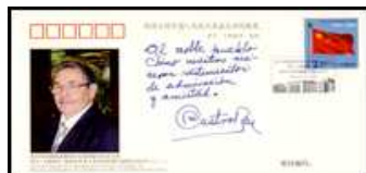
Staatsbesuch des Kubanischen Präsidenten Ruz, 4.-7.7.2012 Chi-PFTN WJ 2012-30 2,00 €