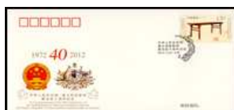
40 J. Dipl. Bezieh. mit Australien 21.12.2012 Chi-PFTN WJ 2012-34 2,00 €