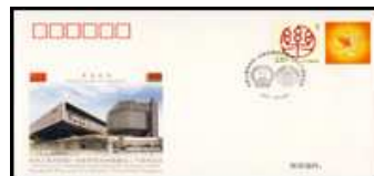
20 J. Dipl. Bezieh. m. Weißrussland 20.1.2012 Chi-PFTN WJ 2012-7 2,00 €