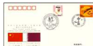
15 J. Dipl. Bezieh. m. Qatar 09.07.2003