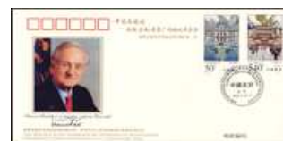
Staatsbesuch durch Joh. Rau 10.09.2003