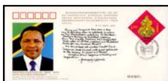
Besuch des Präsidenten von Tansania, 21.10.2014 Chi-PFTN WJ 2014-17 2,00 €