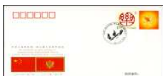
5 J. Dipl. Bezieh. mit Montenegro, 06.07.2011