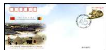
Dipl. Bezieh. mit Kamerun 26.03.2016 Chi-PFTN WJ 2016-3 2,20 €