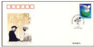
PFTN WJ ( B8 ) - 149 ( 2-1 ) 2 Belege 50 J. friedl. Zusammenleben von China und Indien, 28.06.04