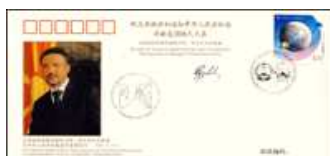
Staatsbesuch durch den Präs. Mazedoniens, 04.12.2007 Chi-PFTN WJ 168 2,00 €