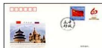
10 J. Dipl. Bezieh. mit Russland, 16.07.2011