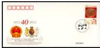
40 J. Dipl. Bezieh. mit Nordirland 13.3.2012 Chi-PFTN WJ 2012-13 2,00 €