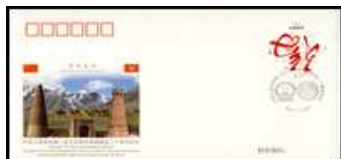
20 J. Dipl. Bezieh. mit Kirgistan 5.1.2012 Chi-PFTN WJ 2012-5 2,00 €