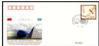
20 J. Dipl. Bezieh. mit Kasachstan 3.1.2012 Chi-PFTN WJ 2012-2 2,00 €