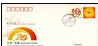
20 Jahre Dialog mit ASEAN, 19.7.2011