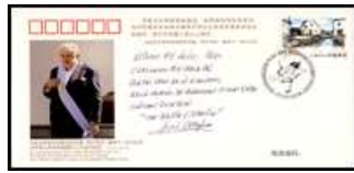
40 J. Dipl. Bezieh. m. Luxemburg 16.11.2012 Chi-PFTN WJ 2013-2 2,00 €