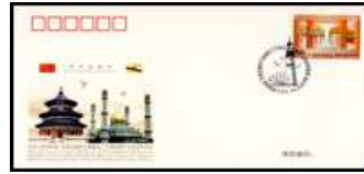
20 J. Dipl. Bezieh. mit Brunei 30.9.2011 Chi-PFTN WJ 2011-16 2,00 €