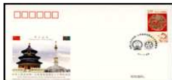
20 J. Dipl. Bezieh. m. Turkmenistan 6.1.2012 Chi-PFTN WJ 2012-6 2,00 €