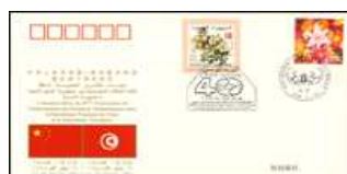
40 J. Dipl. Bezieh. m. Tunesien 10.01.2004