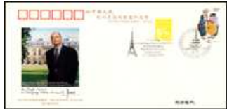
Staatsbesuch durch J. Chirac 08.10.2004 Chi-PFTN WJ 152 2,00 €