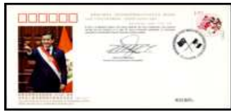
Staatsbesuch des Peruanischen Präsidenten, 05.04.2013 Chi-PFTN WJ 2013-1 2,00 €