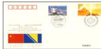
10 J. Dipl. Bezieh. m. Bosn.Herzeg. 03.04.2005 Chi-PFTN WJ 154 2,00 €