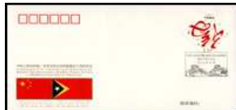
10 J. Dipl. Bezieh. mit Ost-Timor 20.5.2012 Chi-PFTN WJ 2012-22 2,00 €