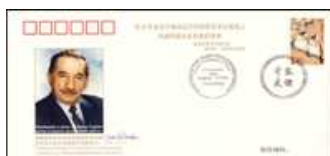
Staatsbesuch durch den Präs. der Rep. Zypern, 04.12.2006 Chi-PFTN WJ 164 2,00 €