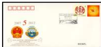
5 J. Dipl. Bezieh. mit Costa Rica 1.6.2012 Chi-PFTN WJ 2012-26 2,00 €