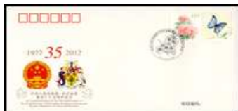
35 J. Dipl. Bezieh. mit Barbados 30.5.2012 Chi-PFTN WJ 2012-25 2,00 €