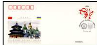
20 J. Dipl. Bezieh. mit Ukraine 4.1.2012 Chi-PFTN WJ 2012-3 2,00 €