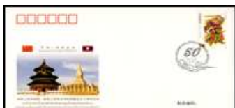
50 J. Dipl. Bezieh. Mit Laos, 25.4.2011