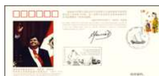
Staatsbesuch durch den Präs. Perus, A.G. Perez, 18.03.2008 Chi-PFTN WJ 170 2,00 €