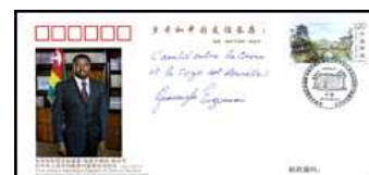
Dipl. Beziehungen mit Togo 29.05.2016 Chi-PFTN WJ 2016-8 2,20 €