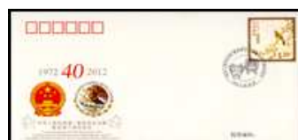
40 J. Dipl. Bezieh. mit Mexiko 14.2.2012 Chi-PFTN WJ 2012-11 2,00 €