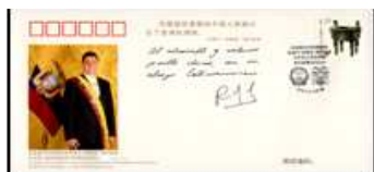
Besuch des Ecuador. Präsidenten 05.01.2015 Chi-PFTN WJ 2015-1 2,00 €