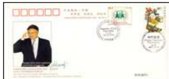
Staatsbesuch durch P. Musharraf 19.02.2006 Chi-PFTN WJ 160 2,00 €