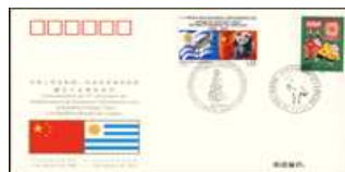
15 J. Dipl. Bez. m. Uruguay 03.02.2003