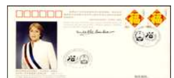
Staatsbesuch durch die Chilen. Präsidentin, 11.04.2008 Chi-PFTN WJ 171 2,00 €