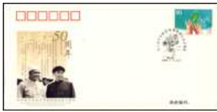
PFTN WJ ( B8 ) - 149 ( 2-2 ) Chi-PFTN WJ 149 3,50 €