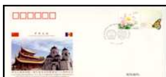
20 J. Dipl. Bezieh. mit Moldawien 30.1.2012 Chi-PFTN WJ 2012-9 2,00 €