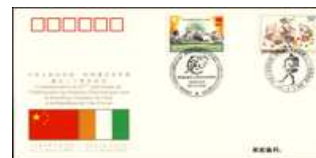
20 J. Dipl. Bez. m. Elfenbeink. 02.03.2003