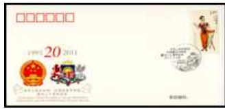
20 J. Dipl. Bezieh. mit Lettland 12.9.2011 Chi-PFTN WJ 2011-14 2,00 €