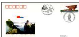
40 J. Dipl. Bezieh. mit San Marino, 06.05.2011