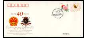
40 J. Dipl. Bezieh. mit Belgien 25.10.2011 Chi-PFTN WJ 2011-17 2,00 €