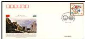
20 J. Dipl. Bezieh. mit Usbekistan 2.1.2012 Chi-PFTN WJ 2012-1 2,00 €