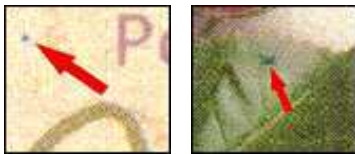
PLF I PIF II